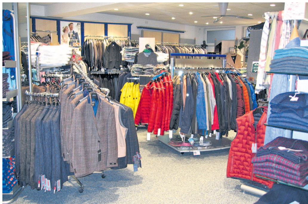
Kautter Kleidung wurde bereits zwei Mal als 1a-Fachhändler ausgezeichnet.