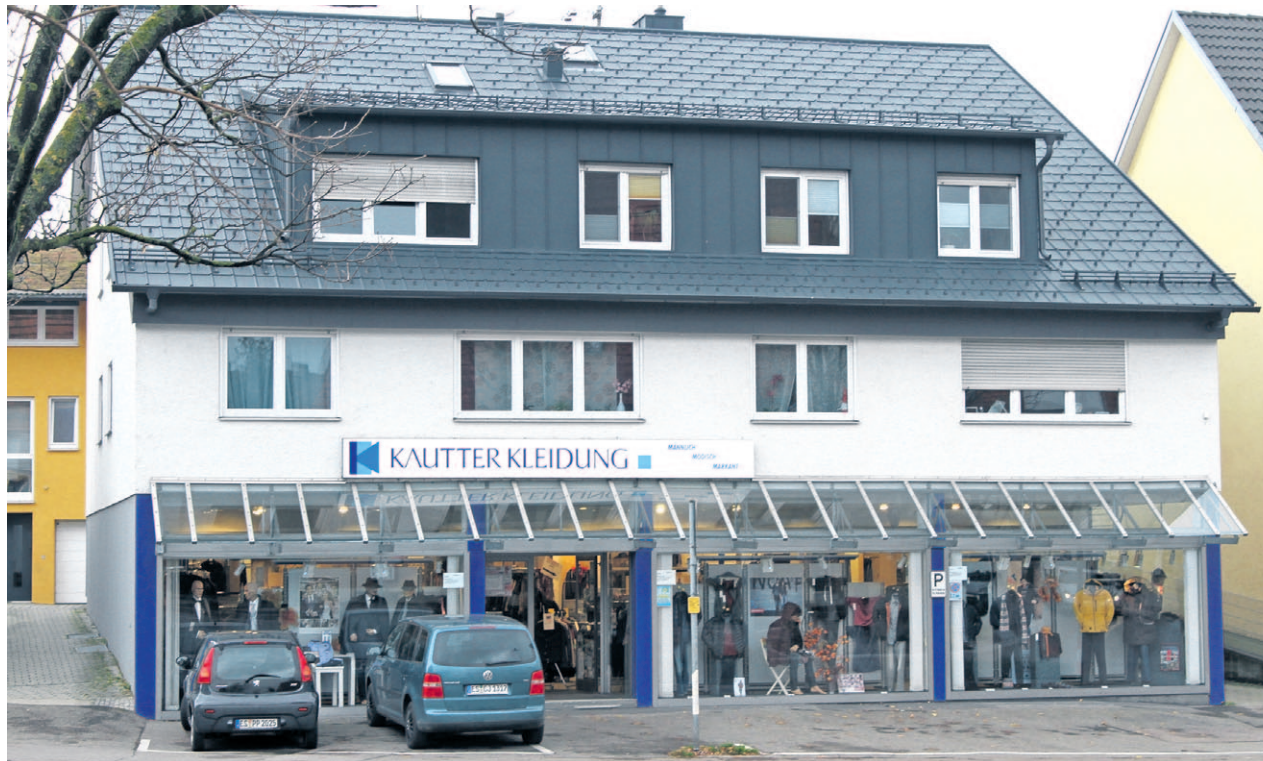
Seit 90 Jahren Top-Adresse für Herrenmode mit individuellem Service in Weilheim: Kautter Kleidung.

Im Hause Kautter legt man Wert auf ein breites Sortiment